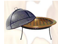
Hoyo de fuego