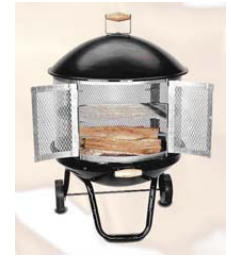
Chimenea al aire libre